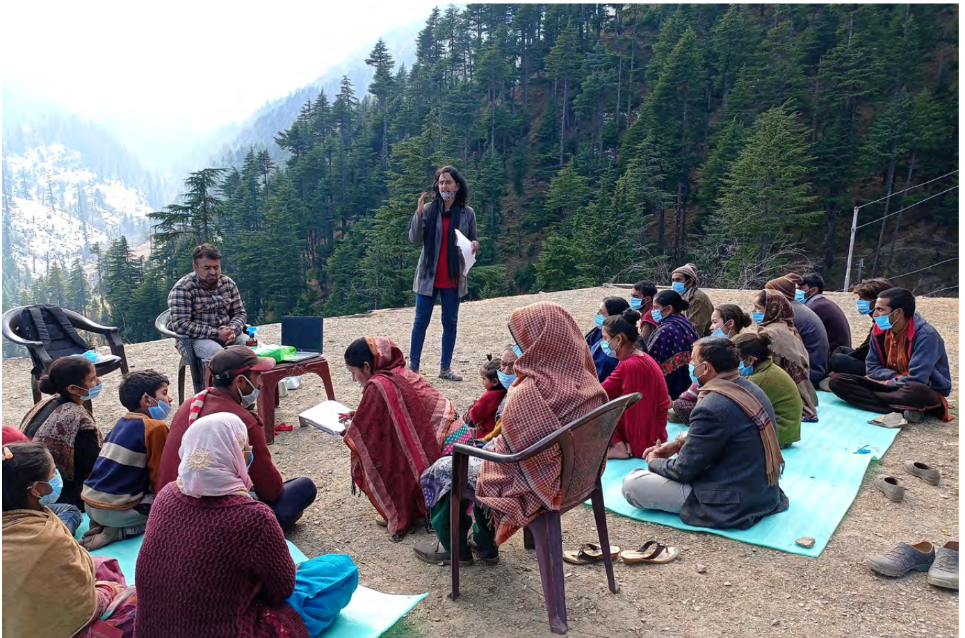
Los residentes de las aldeas de Jammu y Cachemira en la India asisten a una capacitación de FactShala sobre la detección de información errónea.