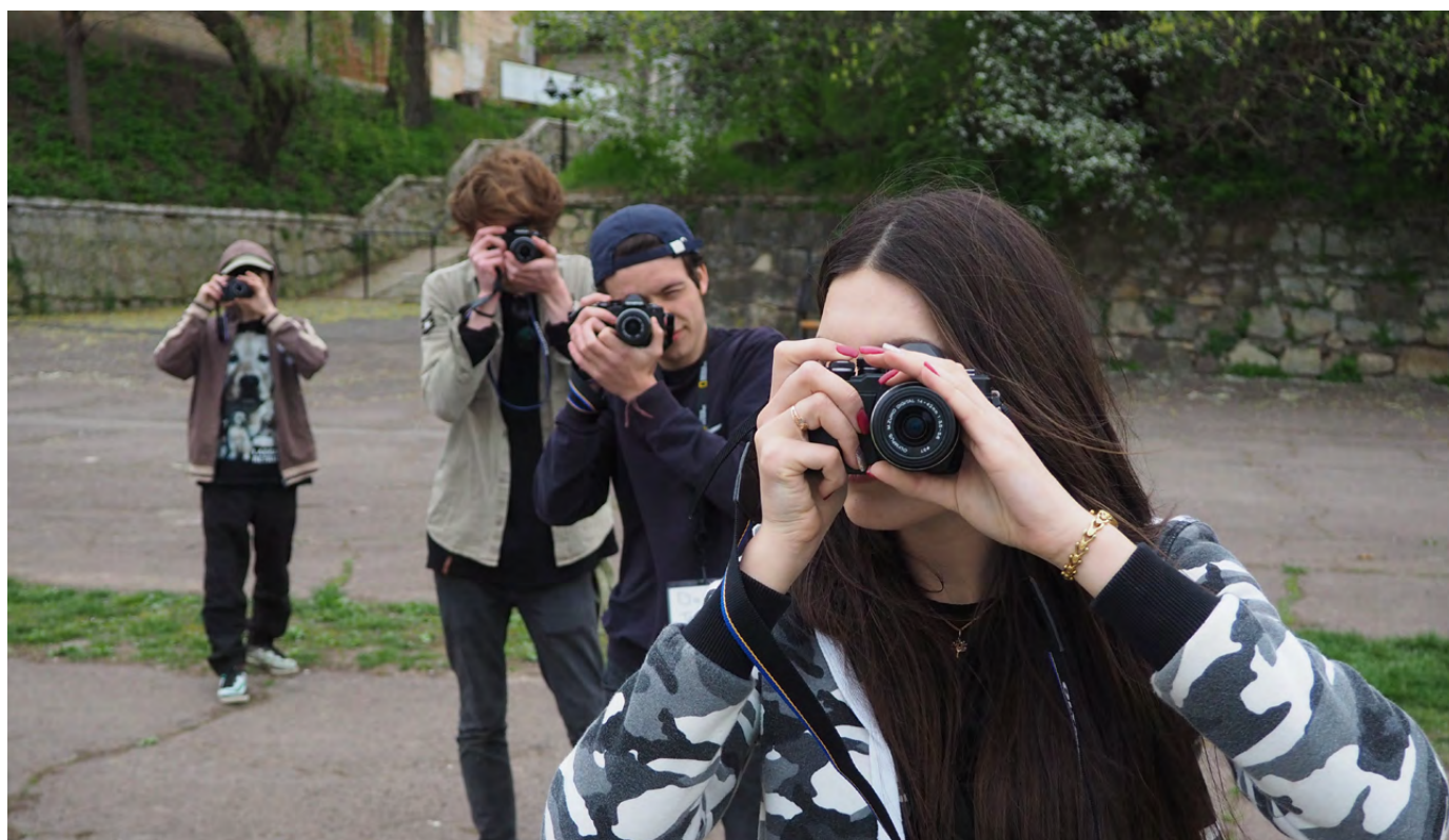
Campamento de fotografía de Internews en Moldavia, en el que se enseña a un grupo de jóvenes a contar historias de manera visual.

Esta estrategia va acompañada de un plan de acción interno y de una caja de herramientas para la igualdad de género y la inclusión. El plan de acción servirá como fundamento de las revisiones anuales para la implantación de esta estrategia. La caja de herramientas está compuesta por siete módulos y aborda diferentes componentes del ciclo de vida del proyecto con pasos y estrategias prácticos para integrar las perspectivas de género interseccionales en diferentes áreas de especialización y programas, al tiempo que sigue estando profundamente anclada en los enfoques locales. La caja de herramientas es un trabajo en constante evolución y seguirá siendo un recurso vivo, que se actualizará y adaptará de forma periódica según evolucionen las necesidades de los equipos y el contexto local.