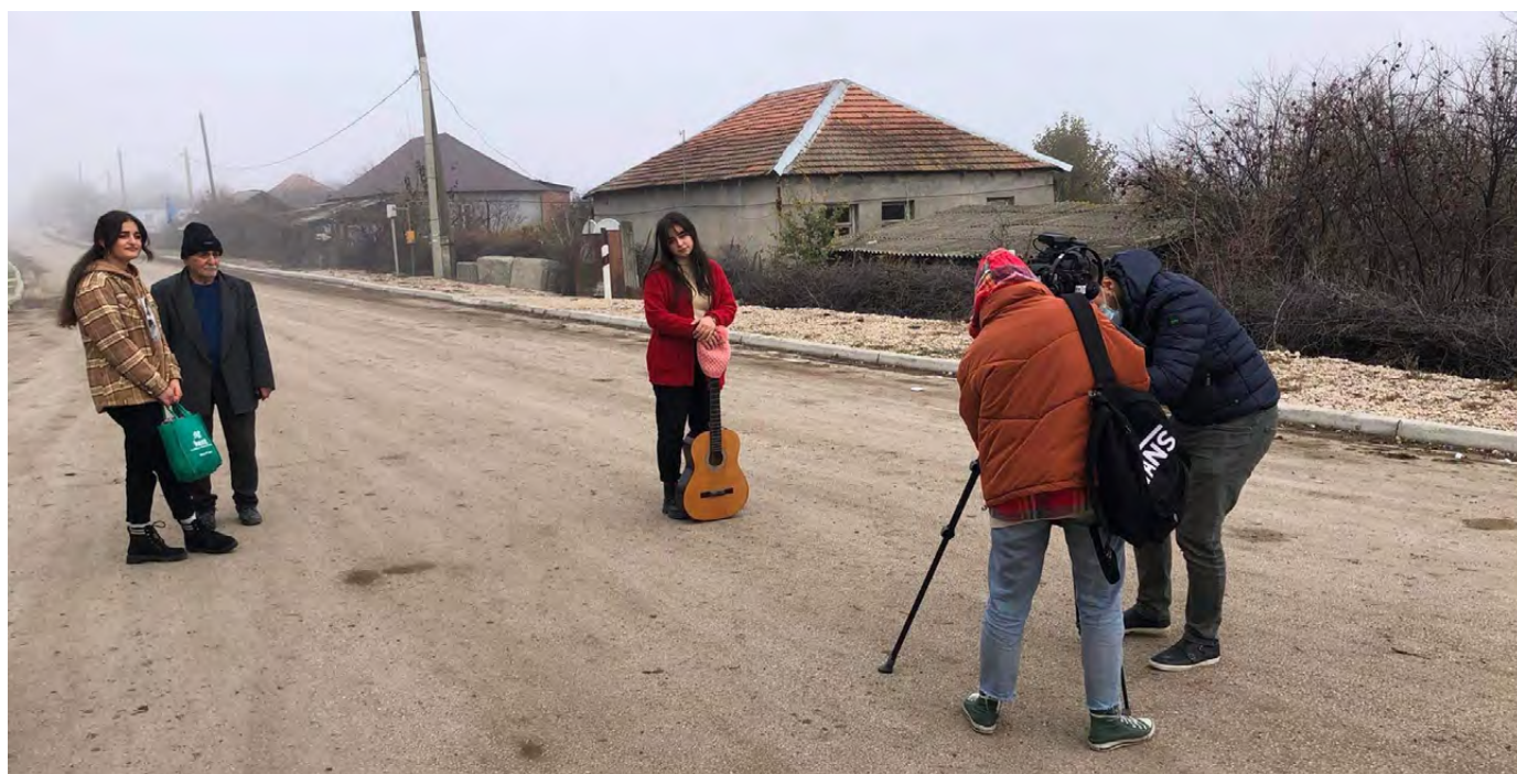
Participantes del campamento piloto IPA FilmAid en Sabatlo (Georgia) graban una escena para un documental.

Seguimos teniendo ambición, pero somos honestos y realistas con respecto a lo que podemos lograr. Reconocemos que todas las personas involucradas en esta tarea pueden beneficiarse de una mejor comprensión de los problemas sensibles y complejos implicados en el cambio de poder en la sociedad, así como de una mayor orientación para lograr nuestra visión. De tal modo, esta estrategia se ve complementada por una Caja de herramientas sobre igualdad de género e inclusión en constante cambio y evolución para dotar al personal de reflexiones, recursos y herramientas para trasladar la estrategia a todos los programas y regiones. También se complementa por el uso continuado de recursos de aprendizaje para fundamentar esta labor con solidez.