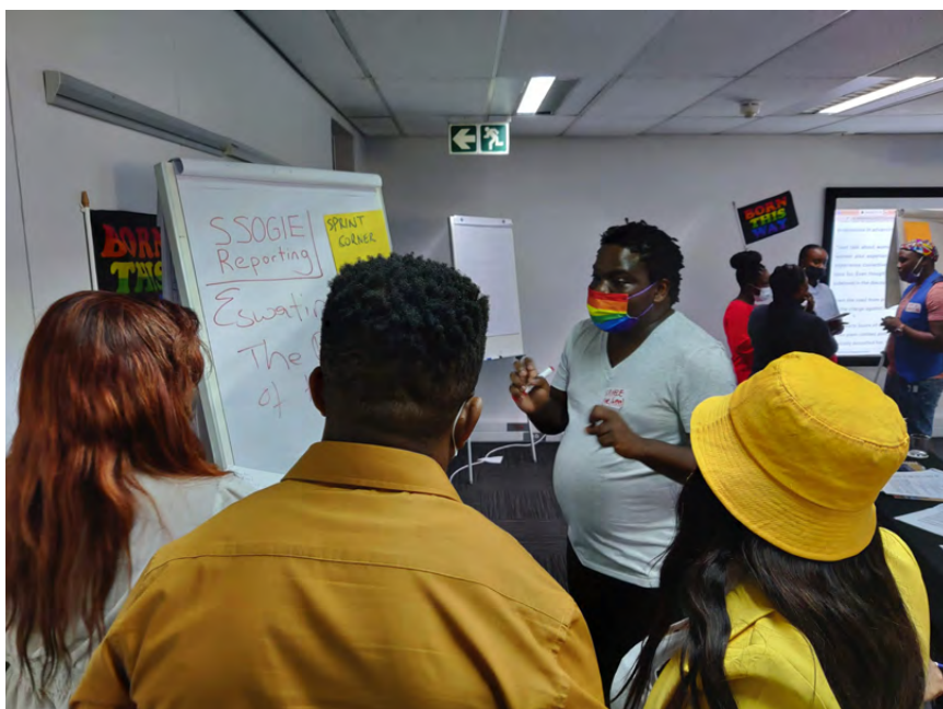
Periodistas regionales entrevistan a activistas LGBTQIA+ durante un taller de presentación de informes sobre la cobertura de las minorías sexuales y de género en Sudáfrica.

Las mujeres sufren desde hace décadas una grave infrarrepresentación y, con frecuencia, una mala representación en los medios. Sus perspectivas a menudo quedan invisibilizadas y hay mucho menos contenido que refleje las voces de las mujeres. En todo el mundo, las mujeres representan un 25 % de las personas que se ven, escuchan y leen en las noticias, además de solo un 24 % de las fuentes especializadas citadas por los medios. 1 El silenciamiento de las voces de las mujeres fomenta una cultura que devalúa a las mujeres y a las niñas, lo que refuerza las normas de género tradicionales y dañinas. Si bien en muchas regiones cada vez más las mujeres se hacen periodistas y están