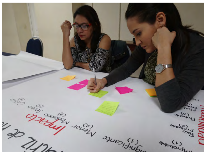
Taller de Internews sobre la seguridad de las periodistas durante las elecciones en El Salvador.

Nuestras alianzas son la piedra angular de nuestro trabajo. Nuestro enfoque sobre las alianzas responsables reconoce que nuestras alianzas son las que están mejor posicionadas para comprender los matices existentes en la comunidad. Internews apoya a las alianzas locales en su compromiso (o en su voluntad por comprometerse) con la igualdad de género y la inclusión en el espacio de la información, lo que abarca tanto el trabajo programático como la práctica y la política organizativa. En el marco de esta labor, apoyamos las auditorías de género e incentivamos a los socios a que adopten códigos éticos y políticas antiacoso. También buscamos aprender de manera continuada de la pericia de nuestros socios