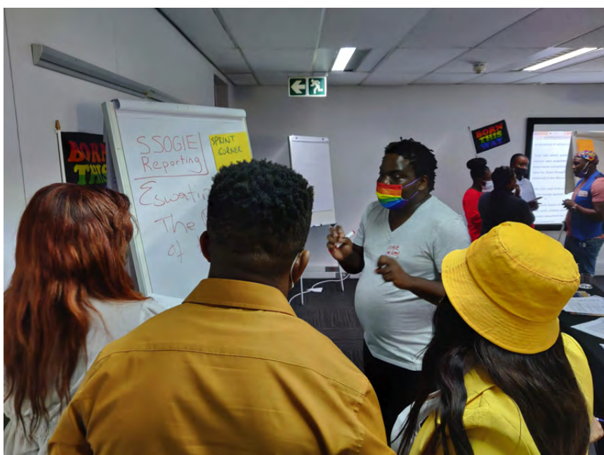
Des journalistes locaux interviewent des militants LGBTQIA+ lors d'un atelier sur la couverture médiatique des minorités sexuelles et de genre dans le sud de l'Afrique.

Depuis des décennies, les femmes sont cruellement sous-représentées ou mal représentées dans les médias. Leur point de vue est fréquemment ignoré et la voix des femmes est rarement mise en lumière. Dans le monde entier, les femmes représentent 25 % des contenus vus, entendus et consultés dans les articles médiatiques et comptent seulement pour 24 % des sources d'experts citées dans les médias. 1 La silenciation des femmes contribue à la pérennisation d'une culture qui dévalorise les femmes et les filles et qui renforce les normes de genre traditionnelles néfastes. Si dans de nombreuses régions, les femmes accèdent progressivement au secteur du journalisme