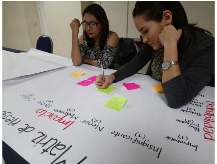
Un atelier d'Internews sur la sécurité des femmes journalistes lors des élections au Salvador.

Nos partenaires sont au cœur de notre action. Notre approche orientée vers des partenariats responsables démontre que nos partenaires sont plus susceptibles de comprendre les nuances à l'échelle des communautés. Internews soutient les partenariats et les alliances locales dans leurs engagements — ou leur volonté à s'engager — en faveur de l'égalité des genres et de l'inclusion au sein de l'espace informationnel, en couvrant à la fois la programmation et les politiques organisationnelles ainsi que les aspects pratiques. Dans ce contexte, nous soutenons les audits de genre et encourageons nos partenaires à adopter le code éthique et les polices en faveur de la lutte contre le harcèlement. Nous nous efforçons également d'apprendre en permanence de l'expertise de nos partenaires.