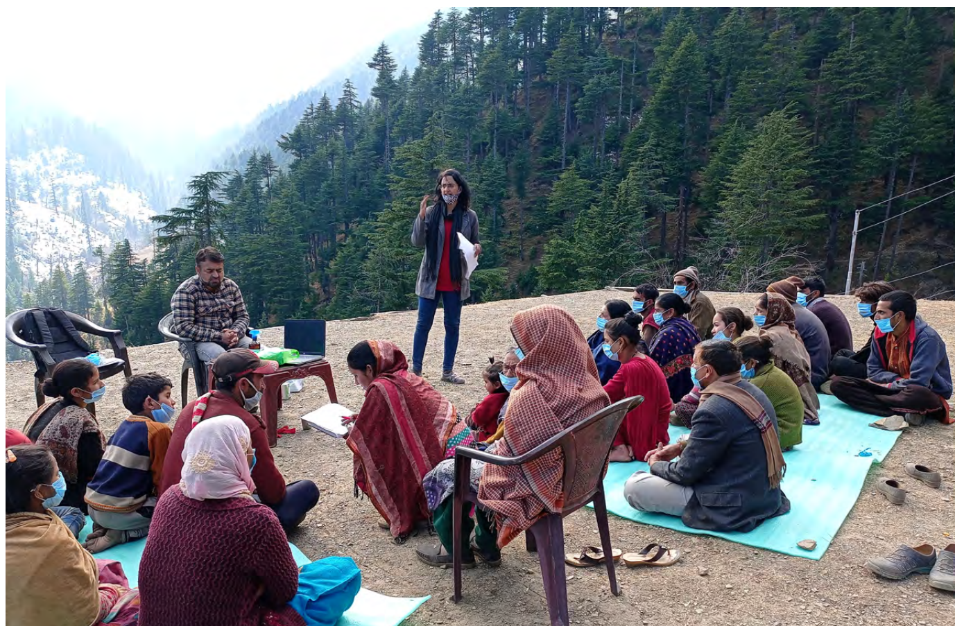
Les habitants des villages du Jammu-et-Cachemire en Inde assistent à une formation FactShala sur la détection de la désinformation.