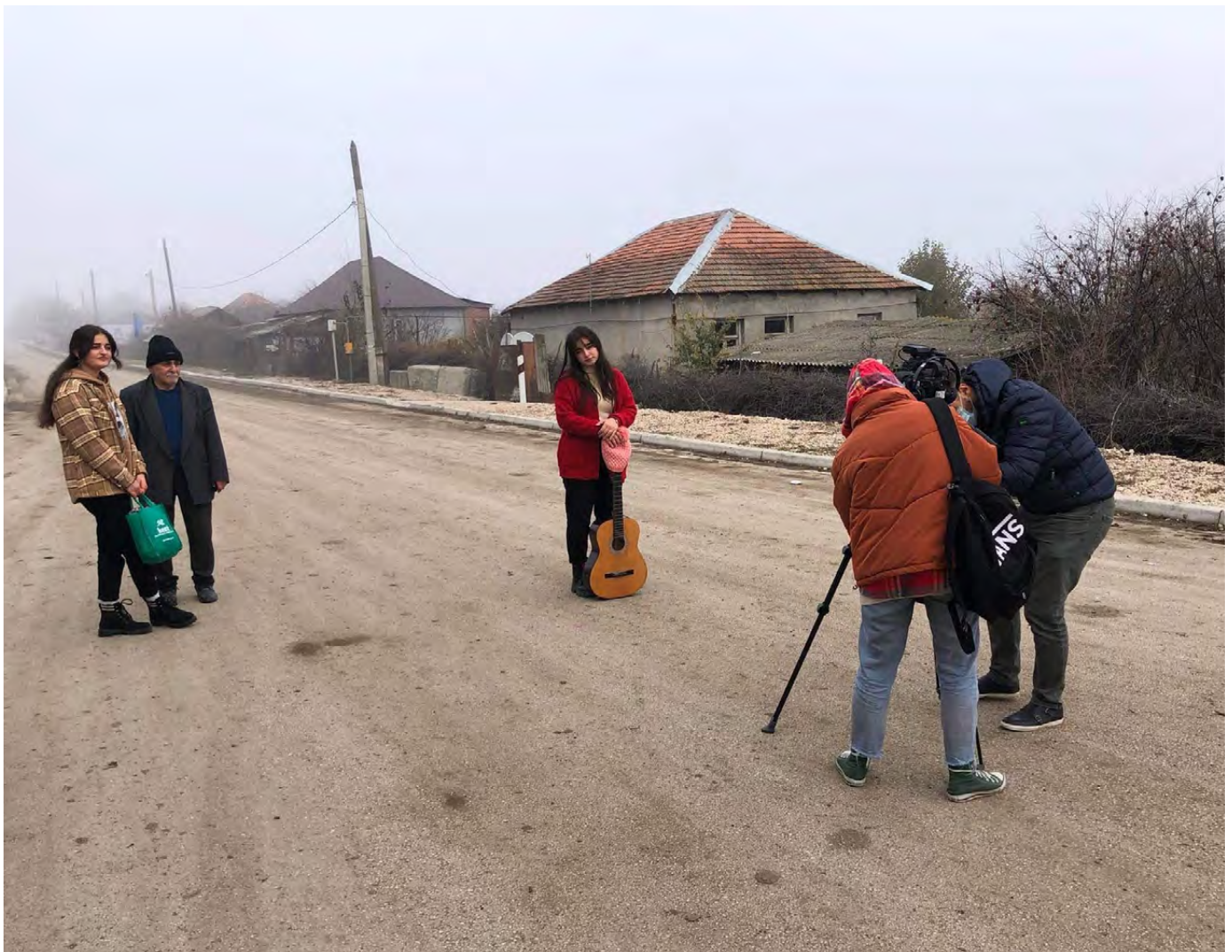
Des participants au stage pilote Georgia/GIPA Film Aid à Sabatlo en Géorgie filment une scène pour un documentaire.

des genres adaptée à chaque situation. Dans la mesure du possible, nous encourageons les relations et favorisons la collaboration continue entre les médias et les défenseurs des droits humains, les groupes de femmes et les organisations de défense des droits des communautés LGBTQIA+.