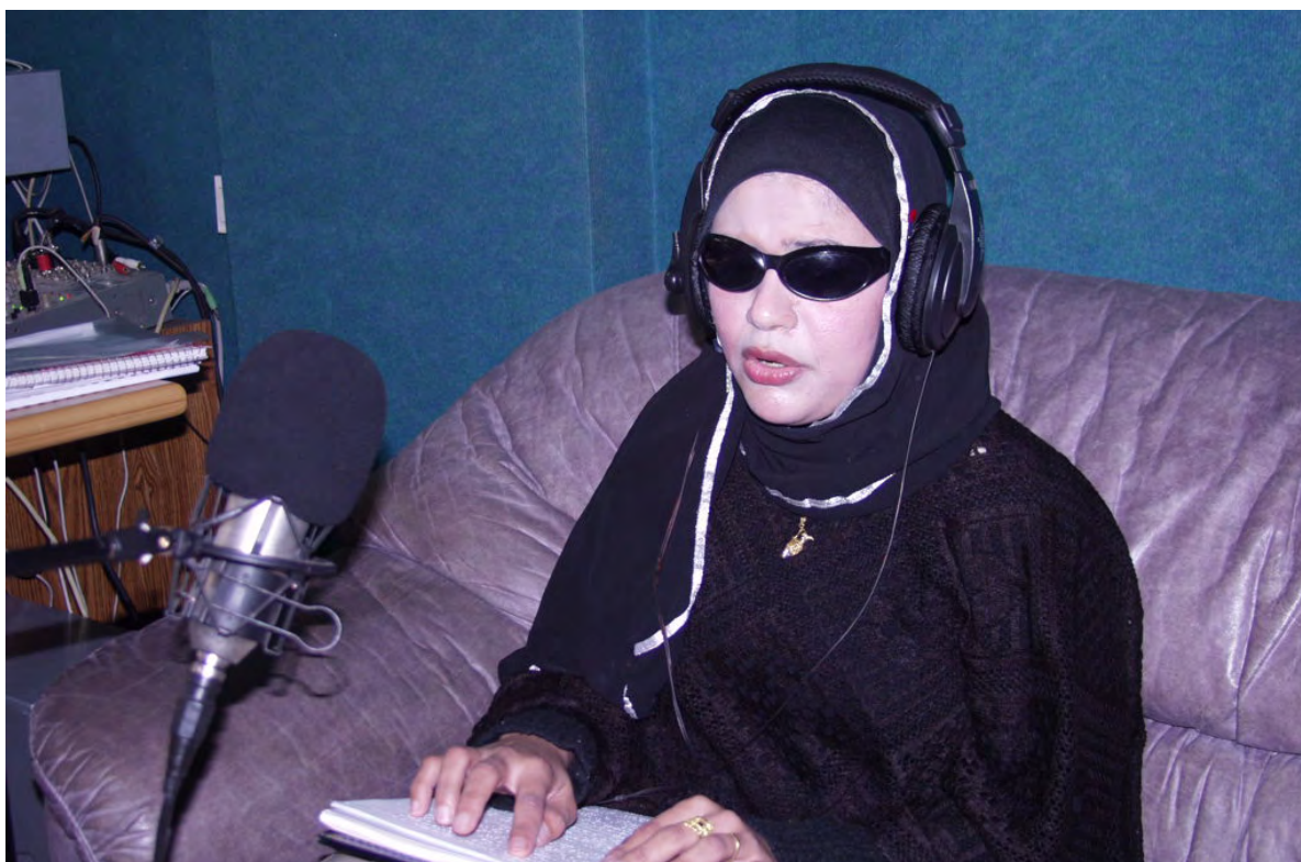
Journaliste radio à Gaza lisant son script en braille.

Elle s'accompagne d'un plan d'action interne et d'une boîte à outils sur l'égalité des genres et l'inclusion. Ce plan d'action servira de base pour l'examen annuel de la mise en œuvre de cette stratégie. La boîte à outils contient sept modules et aborde différentes composantes du cycle de vie du projet avec des étapes pratiques et des stratégies pour intégrer les perspectives intersectionnelles de genre dans les différentes sphères d'expertise et les programmes, tout en restant profondément ancré dans les approches locales. La boîte à outils est en cours de constitution et restera une ressource interactive, mise à jour régulièrement et adaptée en fonction de l'évolution des besoins des équipes et des contextes de changements au niveau local.