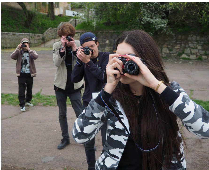
Stage photo d'Internews en Moldavie pour apprendre aux jeunes à raconter des histoires en images.

L'autonomisation désigne le processus d'acquisition de la possibilité de prendre des décisions de vie stratégiques dans un contexte où cette aptitude était impossible auparavant. L'autonomisation des femmes comporte cinq éléments, dont les dimensions civiques, politiques, culturelles, économiques et sociales : (i) l'estime de soi des femmes ; (ii) leur droit à disposer de choix et à faire des choix ; (iii) leur droit à accéder à des opportunités et des ressources ; (iv) leur droit à pouvoir contrôler leur propre vie dans leur foyer et en dehors de ce dernier (v) et leur capacité à influencer le changement social pour créer un ordre socio-économique plus juste à l'échelle nationale et internationale. 23