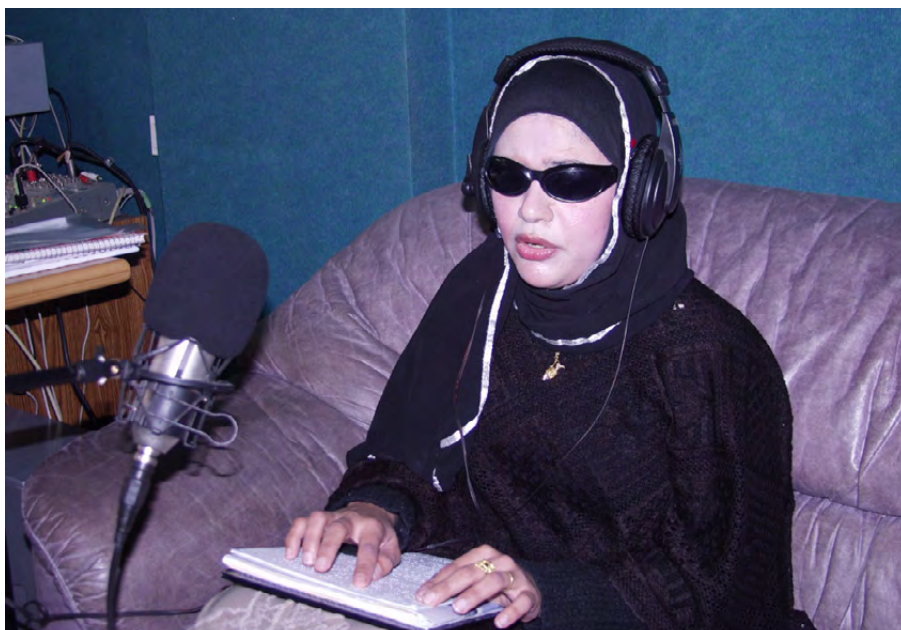
Радиожурналистка в Газе читает свой сценарий шрифтом Брайля.

Гендерная идентичность: Относится к врожденному самовосприятию и идентификации