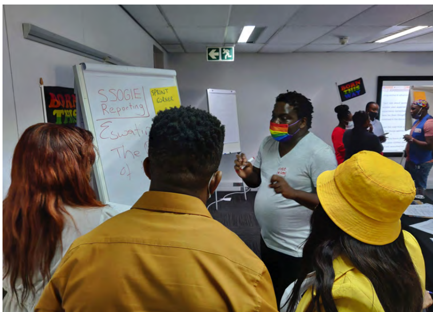
Regional journalists interview LGBTQIA+ activists during a reporting workshop on Covering Gender and Sexual Minorities in Southern Africa.

Женщины крайне недопредставлены и часто искажены в СМИ, и так было на протяжении десятилетий. Их взгляды часто остаются незамеченными, а женские голоса звучат в гораздо меньшем количестве материалов. Во всем мире женщины составляют 25% тех, кого видят, слышат и о ком читают в новостях, и 24% экспертов, цитируемых новостными СМИ. 1 Замалчивание женских голосов способствует формированию культуры, обесценивающей женщин и девочек, укрепляя традиционные и токсичные гендерные нормы. Хотя во многих