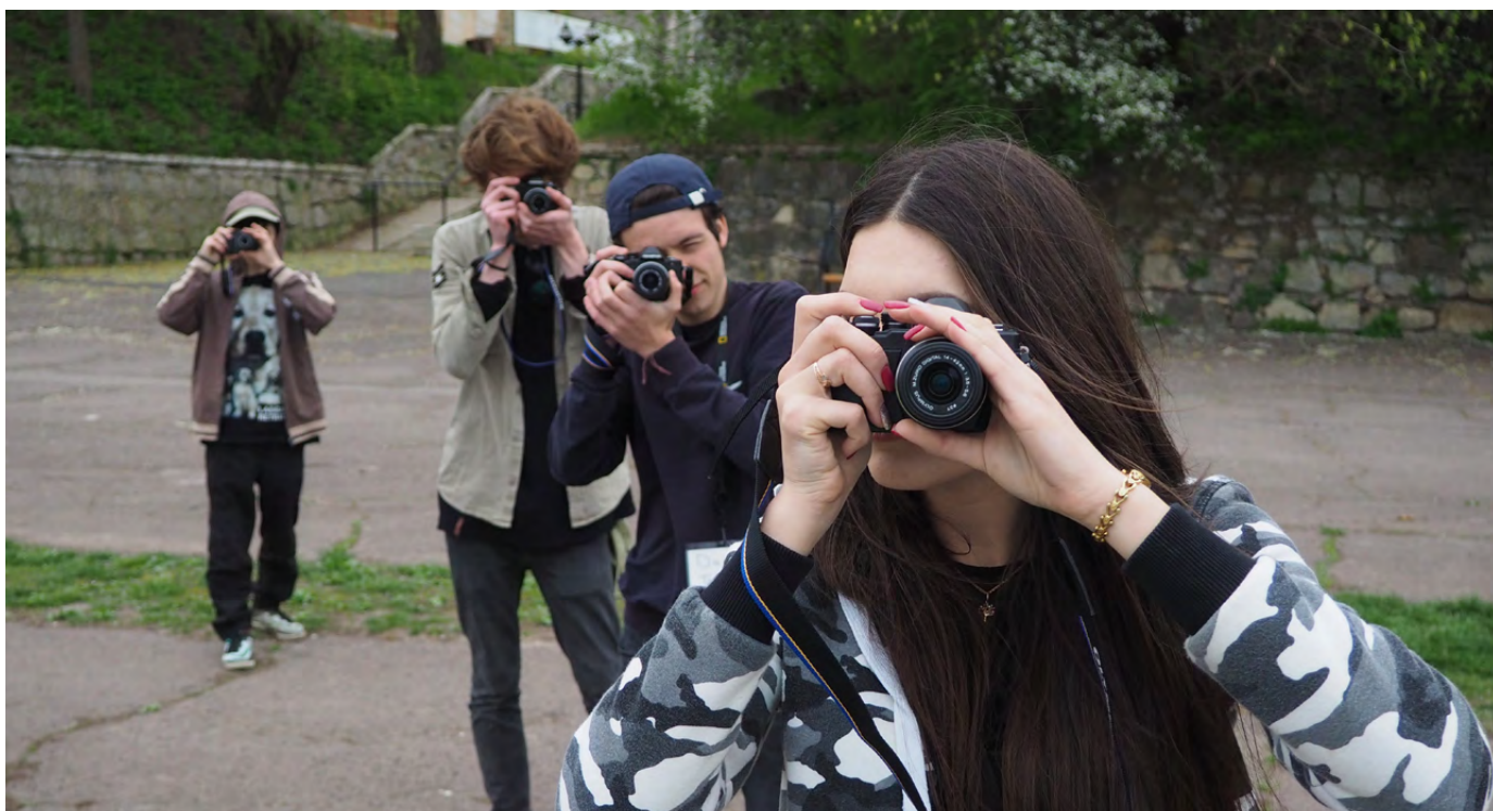
Фотолагерь Internews в Молдове обучает рассказывать визуальные истории.

пять компонентов, включая как гражданские, так и политические, а также культурные, экономические и социальные аспекты: (i) чувство собственного достоинства женщин; (ii) их право иметь выбор и определять его; (iii) их право на доступ к возможностям и ресурсам; (iv) их право иметь возможность контролировать свою собственную жизнь как внутри дома, так и за его пределами; (v) и их способность влиять на направление социальных изменений для создания более справедливого социального и экономического порядка на национальном и международном уровнях. 23