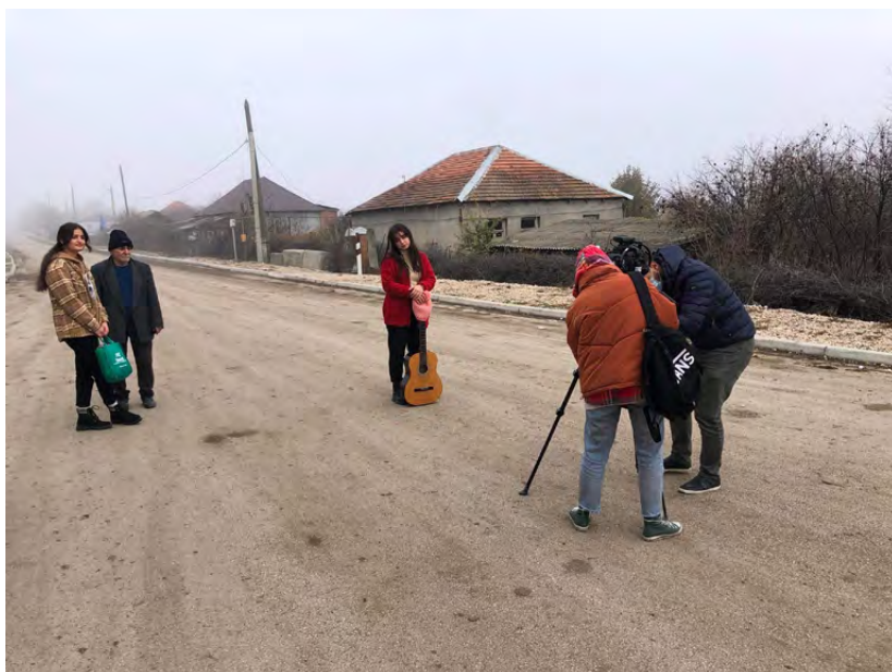
Участники пилотного лагеря FilmAid в Грузии / GIPA в Сабатло снимают сцену для документального фильма.

Мы остаемся амбициозными, но в то же время честными с самими собой и реалистичными в отношении того, чего мы можем достичь. Мы признаем, что любой, кто участвует в этой работе, может извлечь выгоду из лучшего понимания деликатных и сложных вопросов, связанных с передачей власти в обществе, а также из дополнительных рекомендаций для достижения нашего видения. Как таковая, эта стратегия дополняется живым и развивающимся инструментарием для обеспечения гендерного равенства и инклюзивности, который предоставляет сотрудникам размышления, ресурсы и инструменты для практической реализации стратегии в рамках программ и регионов, а также для постоянного развития учебных ресурсов для осмысленной информации об этой работе.