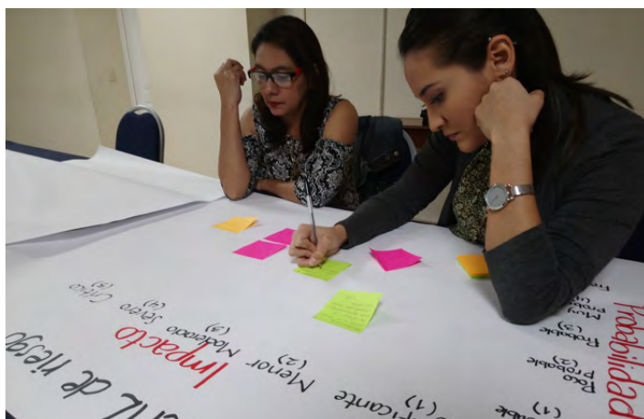
Семинар Internews по вопросам безопасности для женщин-журналистов во время выборов в Сальвадоре.

Эта стратегия сопровождается внутренним планом действий и инструментарием для обеспечения гендерного равенства и инклюзивности. План действий будет служить основой для ежегодных обзоров хода осуществления этой стратегии. Инструментарий состоит из семи модулей и охватывает различные компоненты жизненного цикла проекта с практическими шагами и стратегиями для интеграции межсекторальных общих перспектив в различных областях знаний и программах, оставаясь глубоко укоренившимся в местных подходах. Инструментарий находится в стадии разработки и будет оставаться живым ресурсом, регулярно обновляемым и корректируемым по мере развития потребностей команд и изменения местных условий.