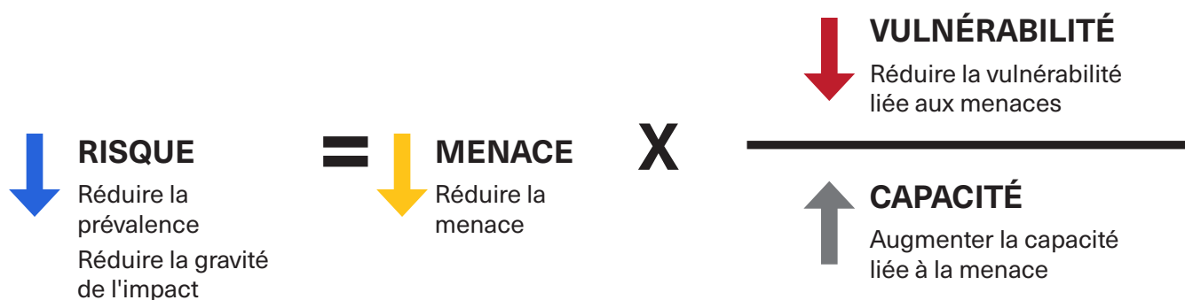
Équation du risque de protection (Global Protection Cluster)

Risque de protection : Exposition réelle ou potentielle de la population affectée par la violence, la coercition ou la privation délibérée. L'équation du risque de protection (visuel ci-dessous) est une représentation non mathématique des trois facteurs qui contribuent au risque. Un risque de protection survient lorsque la menace et la vulnérabilité (d'un individu ou d'une communauté) sont supérieures à la capacité de prévenir, de répondre et de se remettre de cette menace spécifique (définition du Global Protection Cluster).