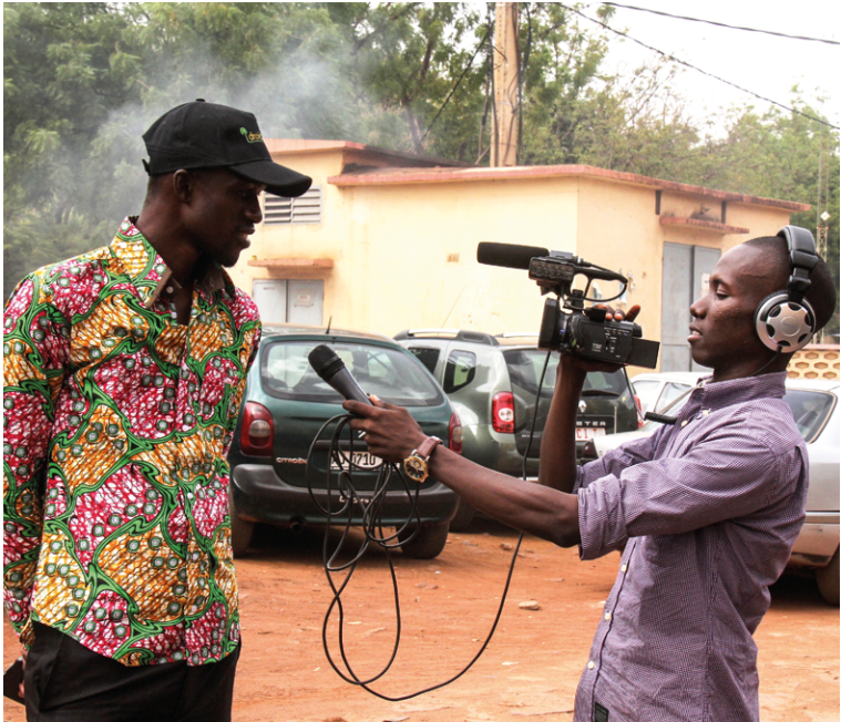
^ Le débat médiatique se nourrit de la diversité d'opinions...