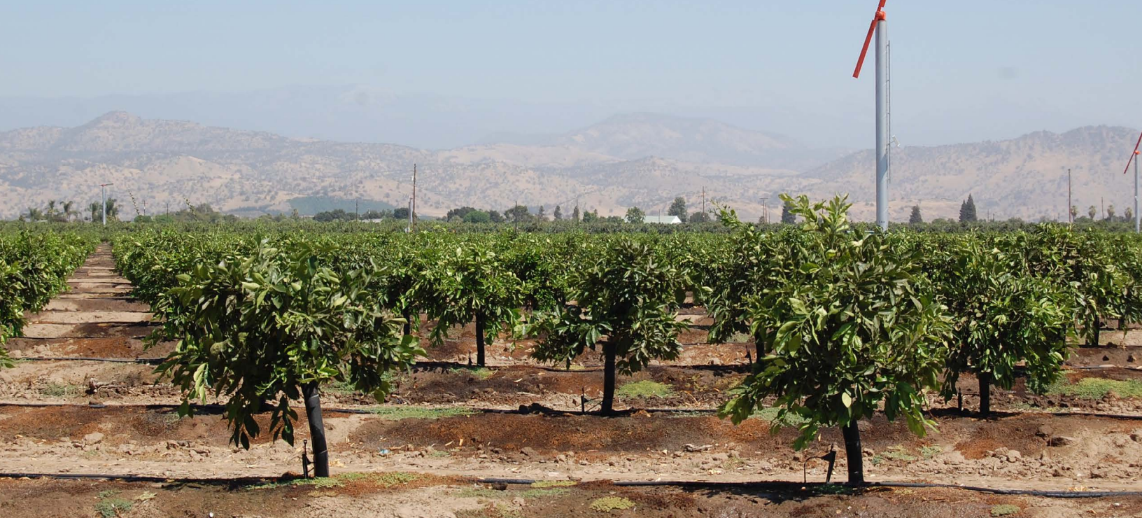
Una huerta de cítricos en Cutler-Orosi, una de las comunidades que incluimos en nuestra evaluación.