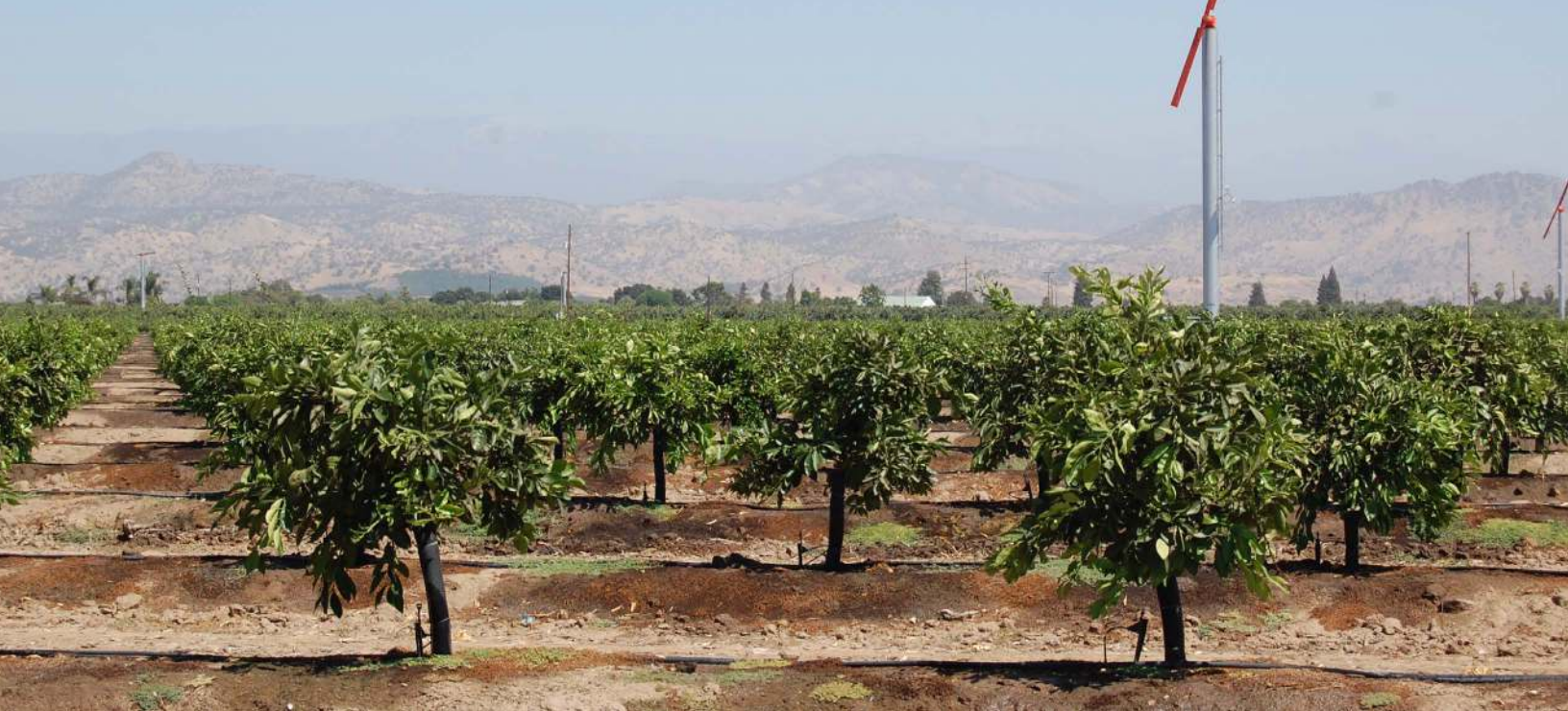
Una huerta de cítricos en Cutler-Orosi, una de las comunidades que incluimos en nuestra evaluación.