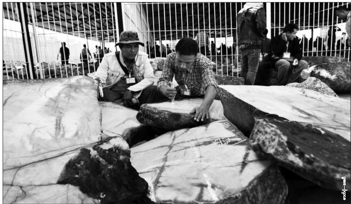
ကျောက်စိမ်းအရောင်းပြပွဲတွေနဲ့ ကျောက်စိမ်းတူးဖော်မှုတွေကနေ ရရှိတဲ့အခွန်ငွေက ပြည်ထောင်စုအခွန်ရရှိမှုငွေအားလုံးရဲ့ သုံးပုံတစ်ပုံခန့်အထိ ရှိနေပါတယ်။

ရန်ကင်း၊ ဒီဇင်ဘာ ၁၃ - ကျောက်စိမ်းသယ်ယူပို့ချရေးကုမ္ပဏီများက နေရာဒေသခွန် နှင့် ဝယ်ယူခွန် အခွန်ငွေတွေ ဆုံးရှုံးနေမှုက အစိုးရသစ်တို့ တွယ်ရမယ့် ပြဿနာတစ်ခု ဖြစ်နေပါ တယ်။