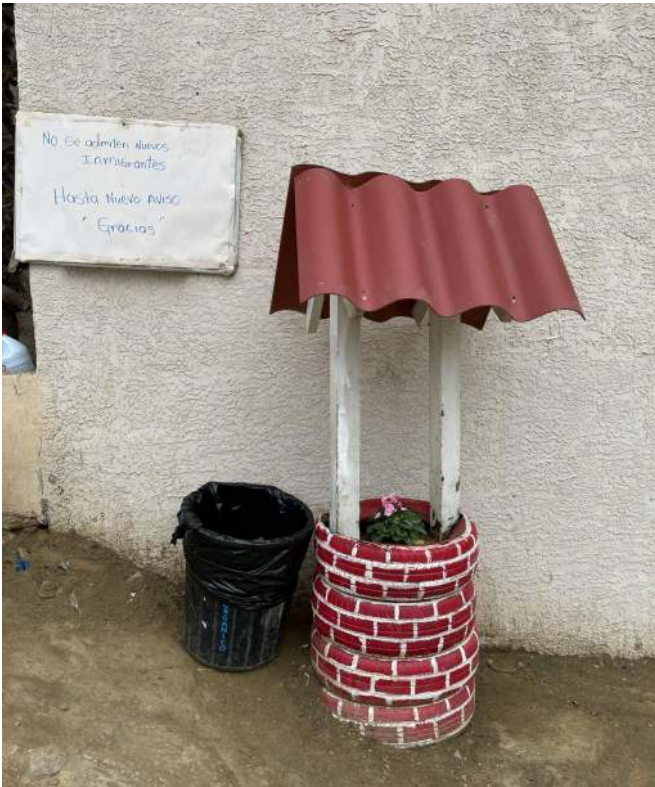
Albergue Embajadores de Jesús, en el Cañón del Alacrán en Tijuana, México.

Los casos de personas migrantes que han sido víctimas de trata con fines de explotación laboral en México han ido en aumento desde el año 2015 y no parece que en el futuro cercano tienda hacia lo contrario. Una de las características de este delito es que las víctimas de explotación laboral muchas veces no saben que sus empleadores están cometiendo un abuso contra ellas.